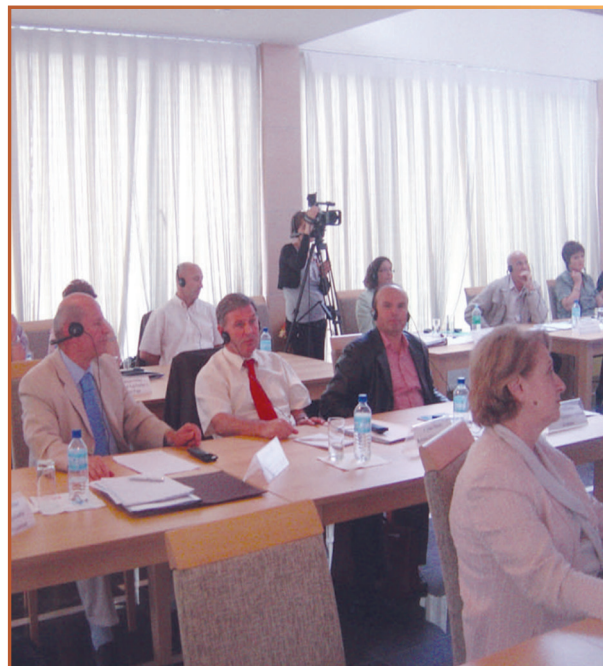
SEMINAR U KIP