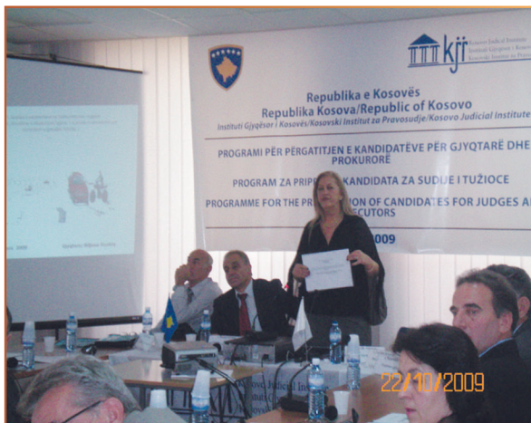
SEMINAR U KIP