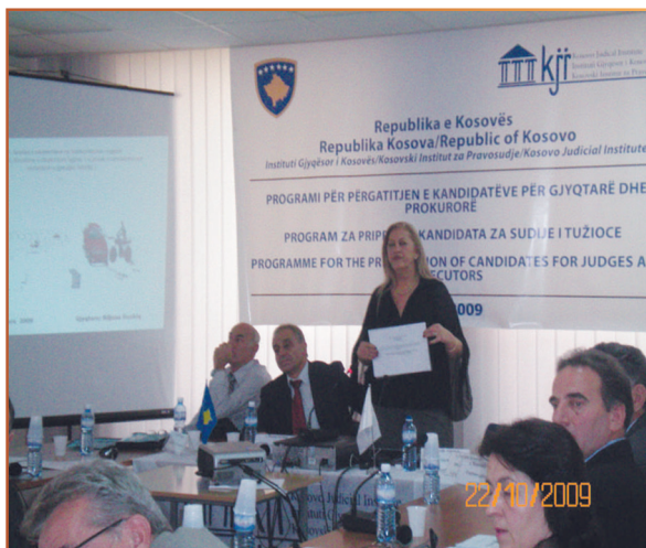
SEMINARET NË IGJK